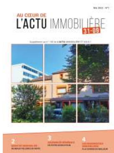
Revue d'informations locales UNPI 31-09